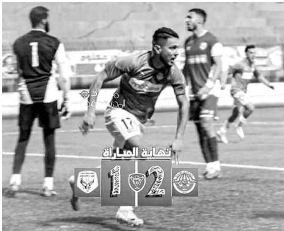
Magra contre USM Alger-Olympique février au stade olympique du 5-Magrane, programmé le dimanche 9 Juillet.

Le Raed rencontrera en 1/8es de finale le vainqueur du match entre le NC