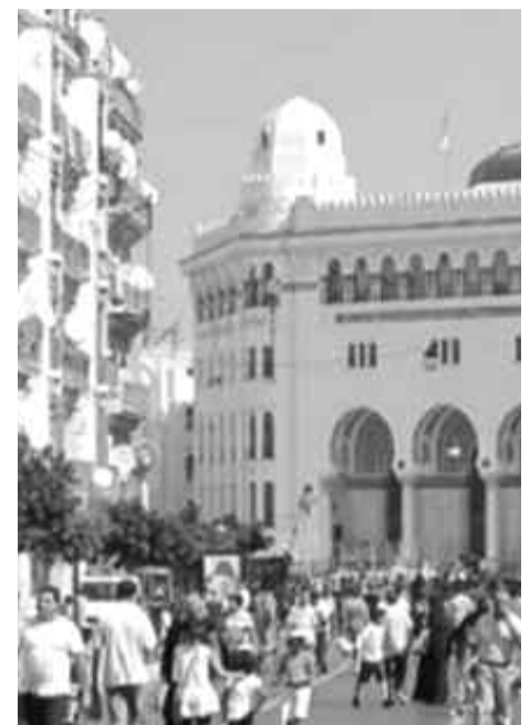
l'Algérie a connu une augmentation de l'inégalité des revenus au cours de ces dernières années.

En effet, 10% des plus riches de la population algérienne détenaient plus de la moitié de la richesse totale du pays, tandis que les 40% des plus pauvres ne possédaient que 7% de la richesse totale. Le rapport avait également souligné que