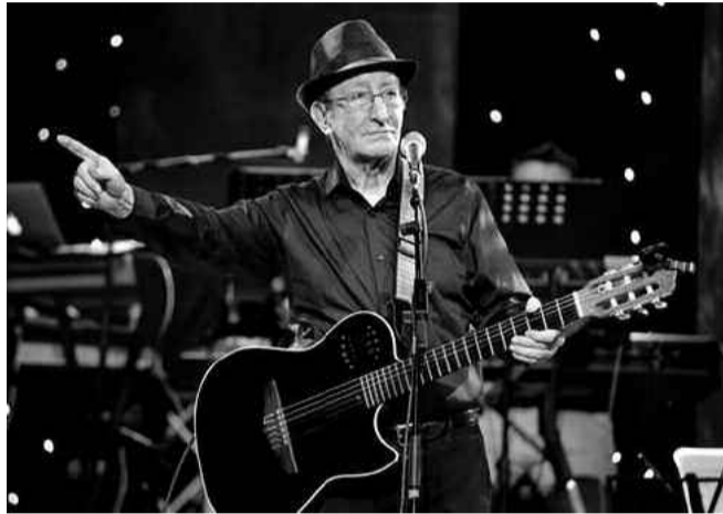
chanteurs de renom à l'instar de Charles Aznavour, Francis Cabrel ou encore Bernard Lavilliers.

Un vibrant hommage a été rendu au chanteur Idir dans son village natal Ath-Lahcene dans la commune d'Ath-Yenni à l'occasion du 1 er anniversaire de sa disparition le 2 mai 2020. Une statue à l'effigie de l'artiste a été inaugurée sur la place du village pour marquer ce premier anniversaire. Le programme de cette célébration a été réduit en raison de la crise sanitaire qui sévit. Une exposition permanente sur l'œuvre et la vie de l'icône de la chanson algérienne d'expression kabyle, des animations artistiques et témoignages de compagnons ainsi que des conférences d'universitaires, en soirée, sont au programme de cet hommage. Né en 1949 à Tizi-Ouzou, Idir, de son vrai nom, Hamid Cheriet, est décédé le 2 mai 2020, dans un hôpital parisien, à l'âge de 71 ans des suites d'une longue maladie. Auteur d'une prolifique discographie à succès dont certains titres ont été repris dans plusieurs langues, Idir s'est produit sur de nombreuses scènes internationales, portant ainsi, la chanson algérienne à l'universalité. Dans son dernier album Ici et ailleurs , sorti en 2017, il s'est associé à une panoplie de