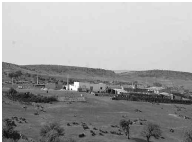
miques dans la planification pour le développement local de ces régions.

L'organisation de cet atelier intervient en "application des orientations du président de la République, portant création d'ateliers de travail pour tenter de trouver des solutions et mesures à prendre pour traiter les obstacles et dysfonctionnements observés lors des visites de terrain effectuées par les ministres dans plusieurs wilayas", a-t-on ajouté. Les débats ont porté sur les principaux facteurs à l'origine de la dégradation de l'environnement dans les zones d'ombre, ses effets négatifs sur le cadre de vie du citoyen, les solutions réalistes recommandées et les modalités d'inclure les services écosysté-