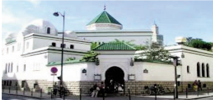
de son prêche tenu en décembre 2017 en sa mosquée d'Empalot à Toulouse, inaugurée le 23 juin 2018 ».

En effet, et dans un communiqué tranchant rendu public avant-hier, le recteur de la GMP écrit que « devant l'ampleur prise par la polémique suscitée par les propos de l'imam Tataï de Toulouse et les malentendus sur notre position, nous tenons à réaffirmer notre condamnation ferme et sans équivoque des termes utilisés par cet imam lors