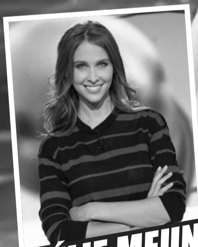
OPHÉLIE MEUNIER TRÈS DISCRÈTE SUR SA VIE PRIVÉE