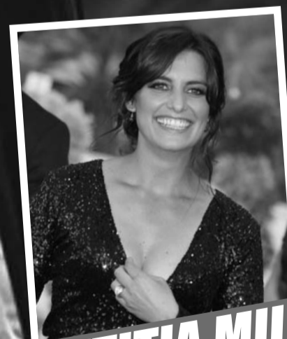
LAETITIA MILOT À L'AFFICHE DU NOUVEAU TÉLÉFILM DE TF1 COUP DE FOUDRE À BORA BORA