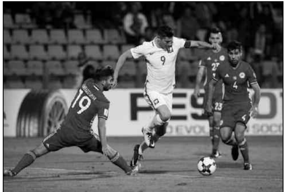
Lutte entre les deux hommes s'annonce bouillante !

L'attaquant du Real Madrid a encore deux matchs à disputer contre Andorre (7 octobre) et la Suisse (10 octobre). La