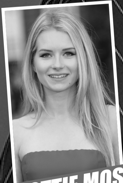
LOTTIE MOSS NOUVELLE ÉGÉRIE CHANEL

Jessica Chastain est à l'affiche du premier long-métrage d'Aaron Sorkin qui raconte l'histoire de la célèbre responsable du cercle de jeu qui avait réuni les plus grandes stars de Hollywood au début du 21 e siècle. Pour incarner le personnage controversé, qui avait défrayé la chronique au moment de son arrestation en 2013 à cause de célébrités qu'elle avait vues passées dans ses soirées poker, Jessica Chastain est allée puiser son inspiration du côté des Kardashian.