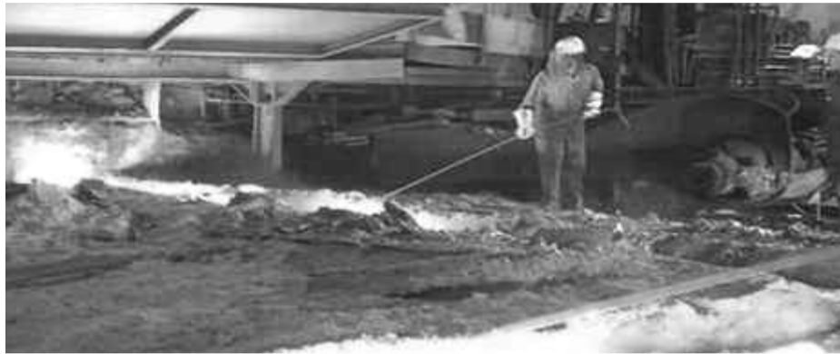
image du fleuron de l'industrie algérienne", a précisé le document.

Rappelant que le but de cette rencontre était d'effectuer un état des lieux sur la situation du complexe, le ministre a saisi l'occasion pour "inciter les différentes parties à travailler en étroite collaboration dans un cadre serein et empreint de fraternité afin de permettre au complexe de retrouver ses niveaux de production et son