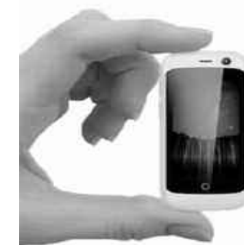
Jelly, The Smallest 4G Smartphone. Amazingly powerful & impossibly small.

Autrement dit des Smartphones dont la taille d'écran est en dessous de 4 pouces. En 2016, c'était Alcatel qui a satisfait cette demande avec son Pixi 4, cette année c'est Jelly, proposé par la société Unihertz, basée à Shanghai. Et son écran mesurant... 2,45 pouces. Il s'agit, ainsi, du plus petit Smartphone 4G sous Nougat... Le Jelly est un tout petit Smartphone, mais c'est un Smartphone quand même. Son chipset est un quad-core cadencé à 1,1 GHz (nous parlons pour le MT6737 de MediaTek) avec 1 ou 2 Go de mémoire vive et 8 ou 16 Go de stockage en fonction