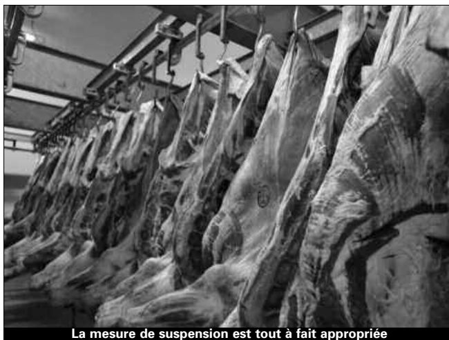
La mesure de suspension est tout à fait appropriée

"Aucune expédition n'a été faite vers l'Algérie dans les 60 derniers jours" note le communiqué de l'ambassade pour rassurer sur le fait que les entreprises brésiliennes impliquées dans ce scandale n'ont