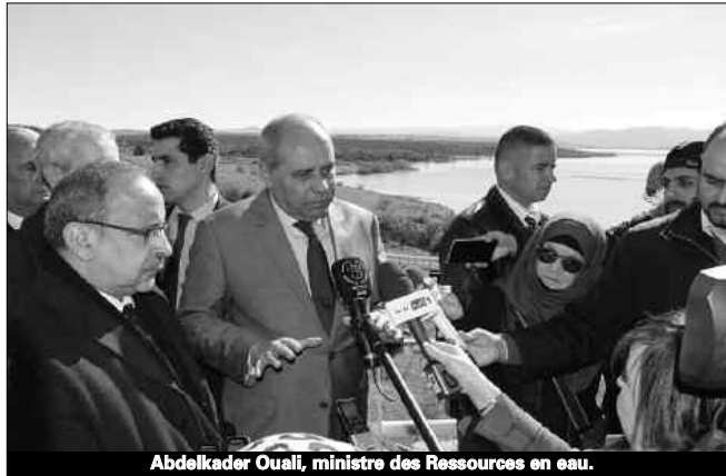
Abdelkader Ouali, ministre des Ressources en eau.

Le ministre, qui était accompagné du wali d'Alger, Abdelkader Zoukh, a précisé que la majorité des importations en équipements et pièces de rechange n'était