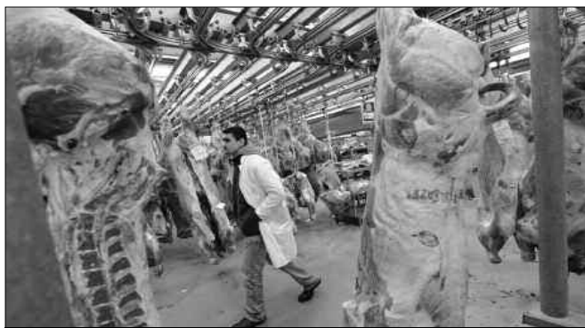
Encore une histoire de gros sous au détriment de la santé publique.

Ce gel fait suite à une opération d'inspection irrégulière menée le 17 mars dernier, par plus de 1.000 agents de la Police fédérale aux abattoirs du Brésil. Au total 21 entreprises exportatrices sont soupçonnées de commercialiser de la viande avariée, dont de grosses boîtes telles que BRF Brésil laquelle est accusée de payer des pots-de-venir pour éviter la fermeture d'une unité à Mineiros et qui aurait exporté des produits contaminés et JBS. Ainsi que de petites sociétés exerçant dans le domaine du froid telles que Mastercans et Peccin, Parana. 5 de ces 21 entreprises ont été suspendues à titre préventif dont 4 sont empêchées d'exporter vers l'UE et Hong Kong. L'enquête qui est en cours a donné lieu à 26 arrestations préventives, 11 emprisonnements temporaires, ainsi que 111 recherches de personnes impliquées.