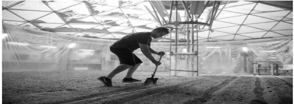
Mars est une phase importante de cette expérience", a-t-il ajouté.