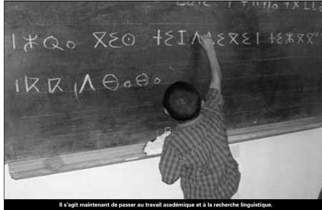
Il s'agit maintenant de passer au travail académique et à la recherche linguistique.

Cette Académie "qui s'appuie sur les travaux des experts, est chargée de réunir les conditions de promotion de tamazight en vue de concrétiser, à terme, son statut de langue officielle". La société qui se réconcilie donc avec son identité, place cet acquis au cœur de ses priorités et de son engagement. La démarche qui est